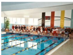
12,5x25x1,2 m 6x12,5x0,4m