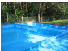
Basen kąpielowy i brodzik