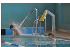
25 x 12,5 x 1,37-1,78 m

Zespół Szkół Technicznych OSTRÓW WIELKOPOLSKI