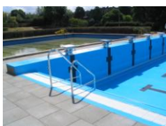
50 x 21 x 1,35-1,9 m