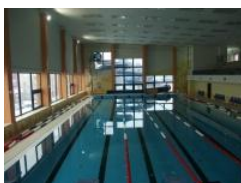
25 x 12,5 x 1,3-2,0 m