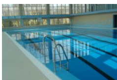
25x15 x 1,2-3,8 m