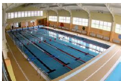
12,5 x 24 x 1,1 ~1,7 m